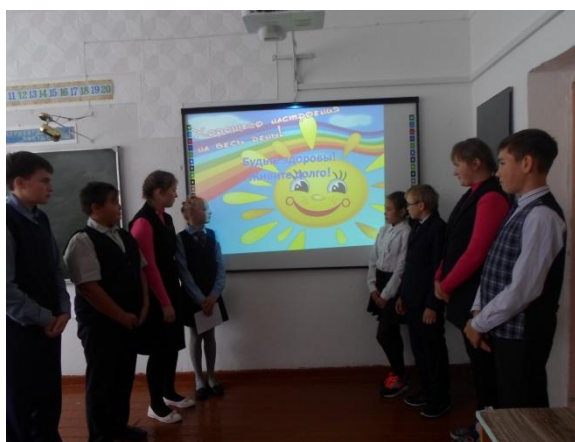
Решение проблемных ситуаций