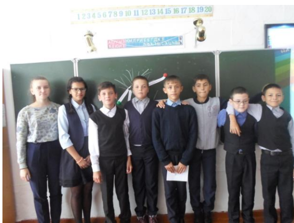
Итог беседы «Верь в себя!»