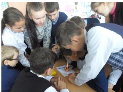
Викторина «Профессия и здоровье»

Подводя итоги мероприятия можно сказать: « Всё услышанное, увиденное тронуло сердца детей. Ребята поняли, что каждый инвалид желает, чтоб к нему относились как к полноценному человеку». И как сказал один из таких людей: «Мы чувствуем себя нормально, как и все другие люди, инвалидами нас делает – отношение людей к нам». Мероприятие прошло в теплой дружеской обстановке.